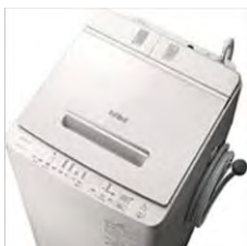
BW-X100G (10kg) 洗剤自動投入機能搭載 99,800円(税別) (109,780円(税込))

今、洗濯機は洗剤自動投入タイプがオススメです。 液体洗剤と柔軟剤を計らずに自動で投入してくれます。 お父さんも洗剤の量を計らずスイッチ入れるだけで、簡単に洗濯できる手間いらずです。 我が家では、使い始めてから、洗剤の減りが遅くなって、洗剤の入れすぎだった事に気がきました!